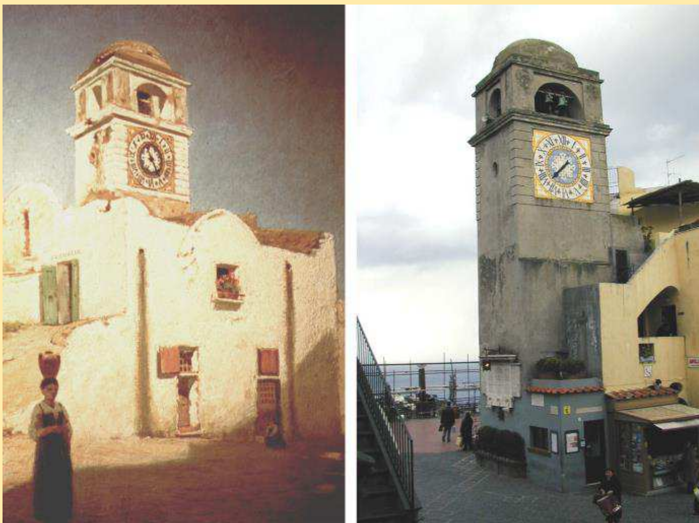
Fig. 2 - A sinistra: Edward Binyon, olio (40x30 cm), collezione privata. A destra: piazza Umberto I di Capri (2003) - Foto Centro Documentale di Capri.

La spinta al progresso sociale ed economico conseguente all'Unità d'Italia interrompe finalmente questa lunga situazione di stallo per Capri. Soprattutto decisivi risultano due fattori: i contributi che il nuovo Stato concede, attraverso le Province, ai Comuni che non dispongano dei fondi necessari al completamento di opere pubbliche di particolare urgenza, e la complessiva lungimiranza degli amministratori dell'isola. Sono queste le principali premesse alla seconda e decisiva trasformazione edilizia dell'antica cittadina, che trova un interprete d'eccezione nell'ingegnere napoletano Emilio Mäyer, giunto nell'isola negli anni '70 per dirigere i lavori della rotabile per Anacapri 2 .