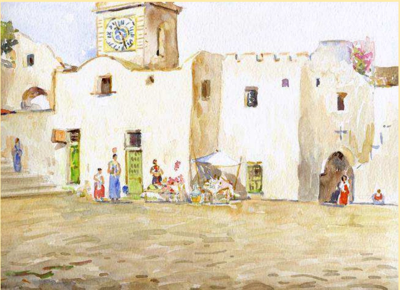
Fig. I - Antonio Palomba, "La piazza di Capri nell'Ottocento" (2002), acquerello. Collezione privata, Capri.

Lo spazio delimitato dalle nuove costruzioni, e in qualche modo comune a tutte, assume lentamente le caratteristiche di una vera e propria piazza. In assenza di documentazione specifica, resta l'ipotesi che sia proprio questo il luogo dove i soldati e quei cittadini cui una speciale disposizione regia ha permesso l'uso delle armi per l'obiettivo condizione di pericolo in cui versano, si esercitano alla difesa. È forse in questo stesso spazio che si svolge l'estrema resistenza al nemico (spesso i corsari) che abbia superato lo sbarramento delle porte e stia per penetrare nell'abitato. Può essere proprio questo il luogo, ancora più rurale che urbano, dove i membri della Universitas si radunano per sovrintendere al governo della cittadina.