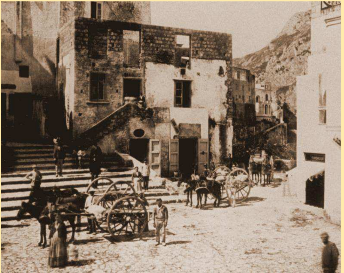
Fig. 3. La piazza di Capri (1890 ca). I segni dell'avvenuta demolizione sono ancora evidenti.

siglio Comunale di Capri del 1872 si ha notizia dell'avvenuta espropriazione da parte della Provincia di un fabbricato posto sul lato di settentrione della piazza, ad occupare l'area oggi compresa tra il Bar Caso e le estreme propaggini del palazzo Arcucci 3 . È quella la costruzione la cui demolizione si rende necessaria per innestare nel cuore della cittadina, una volta ultimata la realizzazione della 'via nuova' (via Roma), la costruenda strada che collega Capri con Anacapri, opera poi ultimata nel 1874.