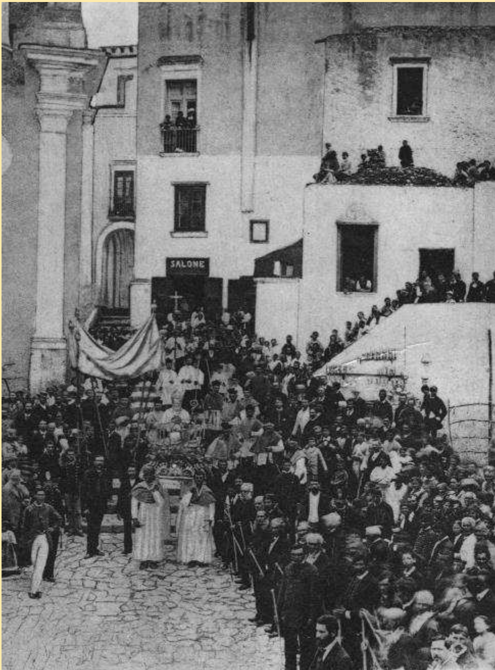
Processione di san Costanzo in piazza, 1875 ca.

I lavori di demolizione si svolgono presumibilmente nel corso del 1873, mentre Mäyer porta a compimento la realizzazione della strada per Anacapri e si progetta l'allargamento del tracciato dell'attuale via Roma, originariamente collegata, attraverso una rampa di scale, alla strada (oggi via Acquaviva) che conduceva anticamente alle porte fortificate della città. In quel luogo si realizza la Villetta Comunale, cioè il panoramico parco pubblico voluto dal Comune. La Villetta, che occupa all'incirca l'area dove sorge oggi la sala-macchine della Funicolare, scompare nel 1906, nel corso dei lavori di costruzione di quest'ultima importante opera.