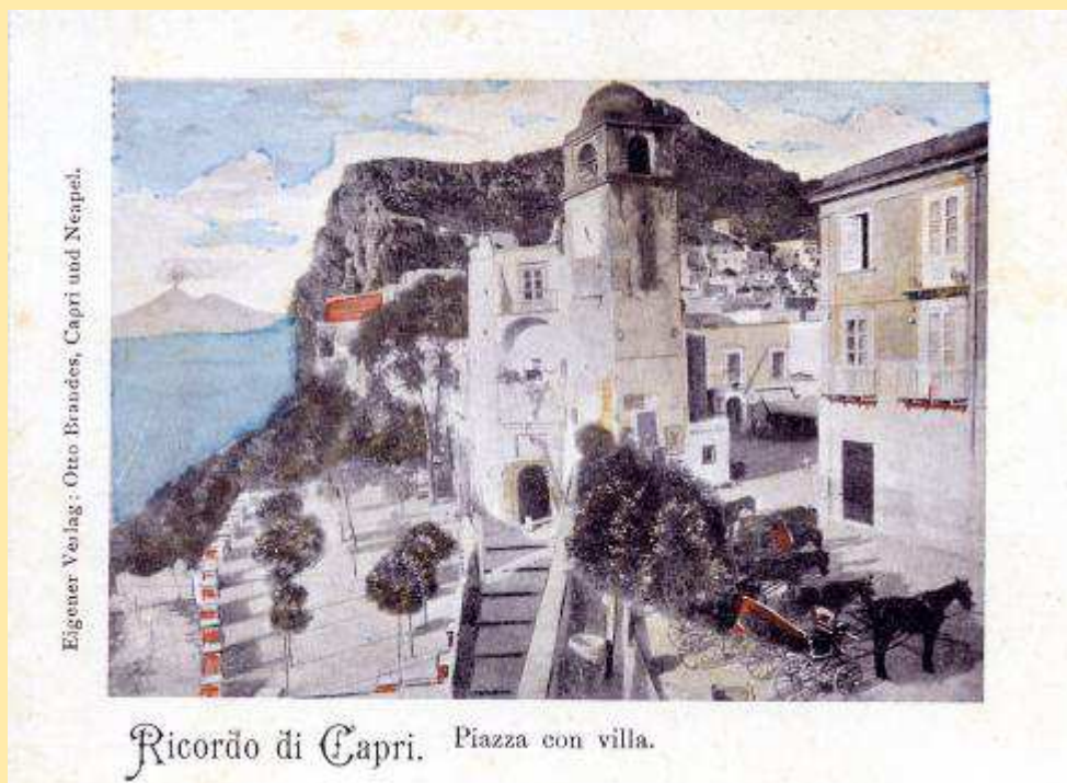
La Villetta Comunale ( a sin. nell'immagine) in una cartolina d'epoca

stante cisterna, un'area di sosta alberata per le carrozze adiacente alla piazza. Anche se la mancanza di un porto e di acqua potabile nell'isola sono destinati ad assillare i suoi amministratori ancora per molto tempo, già molto è stato fatto.